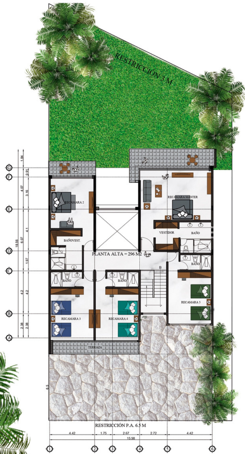
ARQUITECTÓNICO PLANTA ALTA